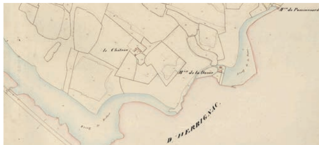
Les étangs en 1835. Les moulins de Pommenard et de la Dame y figurent.

« Le ruisseau du Rodoër vient du moulin du Rodoër qui lui donne son nom, à la sortie de l'estang situé au dessous de la Grée, gentilhommière des appartenances de Pommenard. Et de l'estang