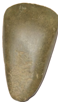
Hache en pierre polie trouvée près de l'étang du Rodoir

de mètres, se trouve l'entrée de souterrains* dont des textes indiquent qu'ils étaient rattachés au château.