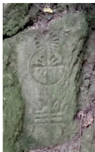
Gravure représentant un ostensor

Le moulin est cité dès le 11 e siècle, sous le nom Pomena, dans un acte du cartulaire de Redon. Au 16 e siècle, il fait partie des