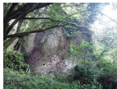
Ruines du moulin de Pommenard