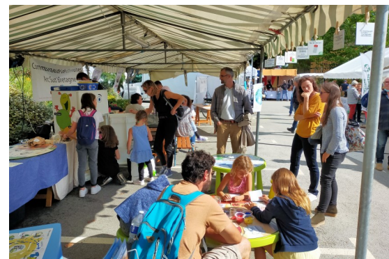
La Bio en Fête MUZILLAC