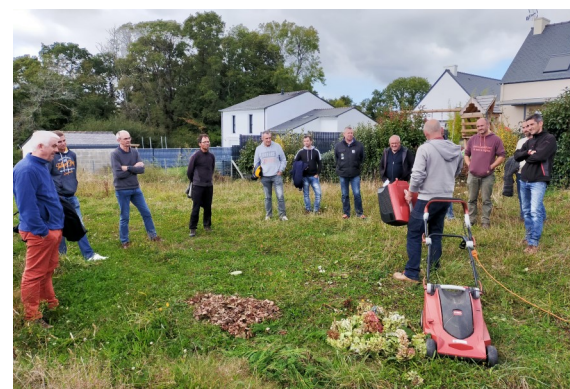
Formation « Prévention et recyclage des déchets verts » par TERHAO