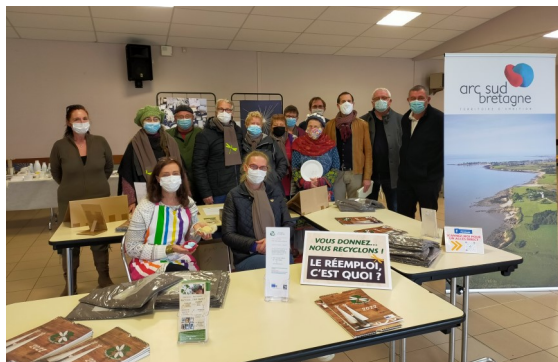
Le Forum « Objectif Z : Créer, Réparer, Inventer » PEAULE