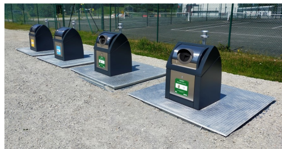
Rue du Lenn à Ambon