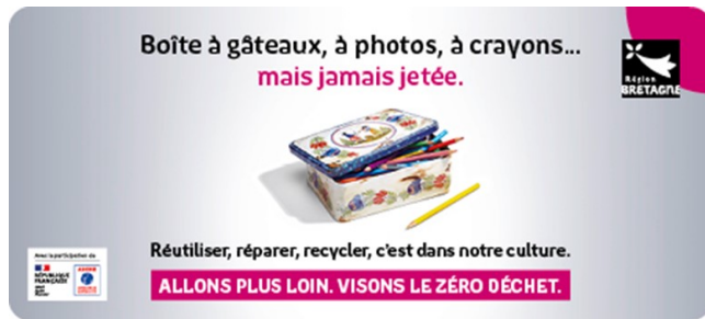
Campagne régionale « Réutiliser - Réparer »