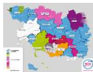
227 communes adhérentes en Production Transport

La population desservie est de 575 480 habitants .